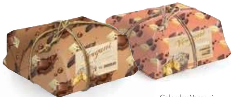
Colomba Vergani - tre cioccolati - pere/ciocolato - cremino - pistacchio/albicocca/ananas 750 g