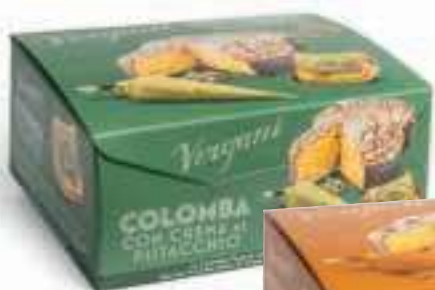
Colomba con crema Vergani vari tipi 850 g