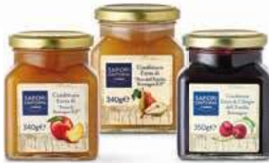
Linea confetture Sapori&Dintorni Conad diverse grammature