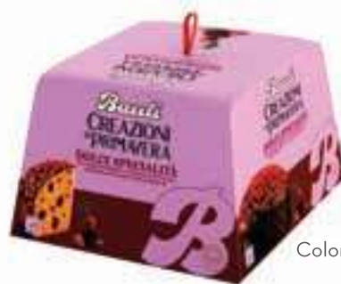
Colomba Creazioni di Primavera Bauli - ciliegie/ciocolato fondente - albicocche/ciocolato bianco 550 g