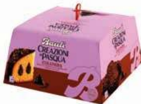
Colomba Creazioni di Pasqua Bauli - cioccolato di Modica - pistacchio - pesca/amaranto 750 g