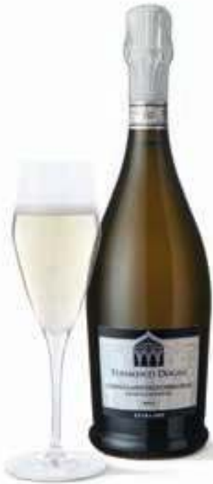
Prosecco Superiore Conegliano Valdobbiadene DOCG Extra Dry Tenimenti Dogali 0,75 l