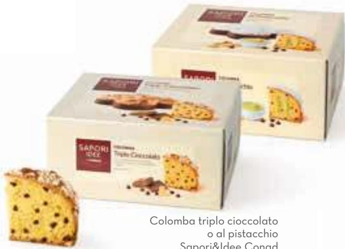
Colomba triplo cioccolato o al pistacchio Saponi&Idee Conad 750/850 g