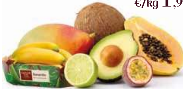
Papaya Sapori&Idee Conad 350 g - cat. I