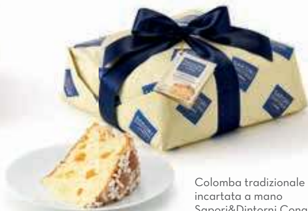
Colomba tradizionale incartata a mano Saponi&Dintorni Conad 1 kg