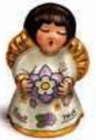
Angelo di cioccolato Thun Bauli 100 g