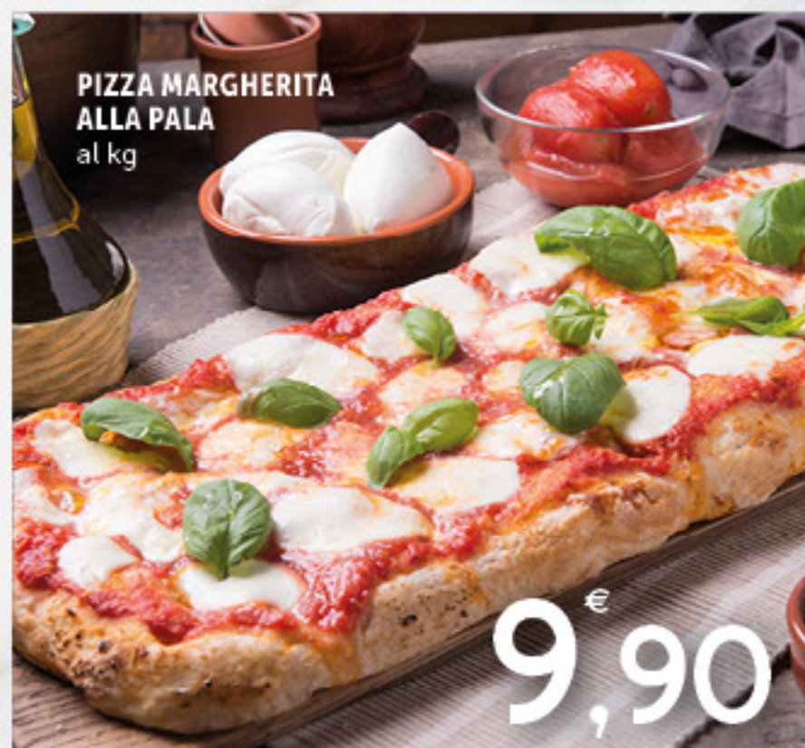
PIZZA MARGHERITA ALLA PALA al kg