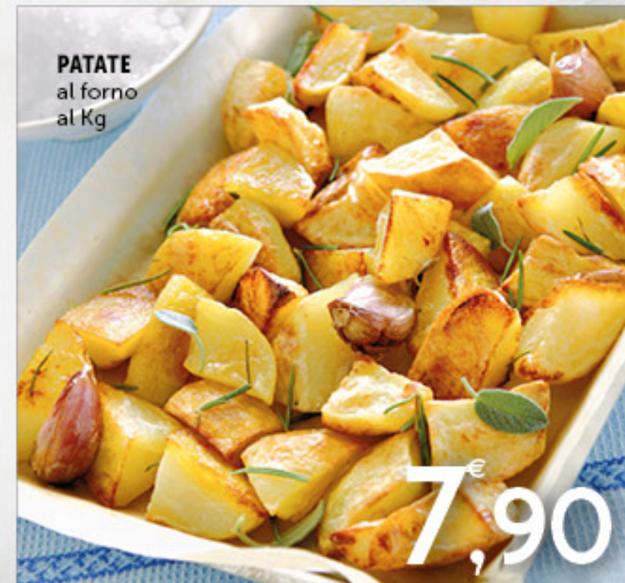
PATATE al forno al Kg