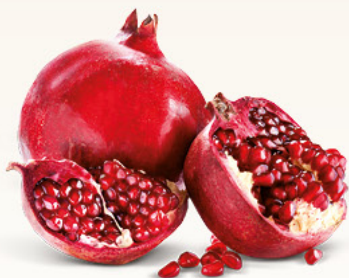
MELAGRANA Italia al kg