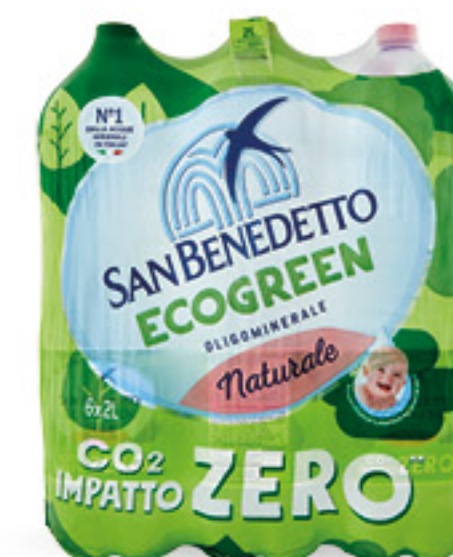
SAN BENEDETTO acqua minerale naturale ecogreen l 2 x 6 bottiglie € 0,14 al lt 1,74