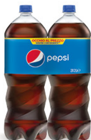
PEPSI COLA l 2 x 2 € 0,67 al lt 2,69