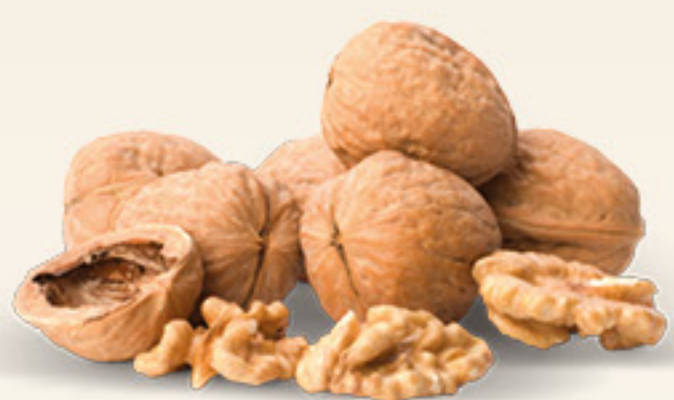
NOCI SORRENTO cat. I origine Italia al kg