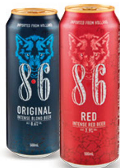
BAVARIA birra 8•6 cl 50 • red • original € 2,78 al lt 1,39