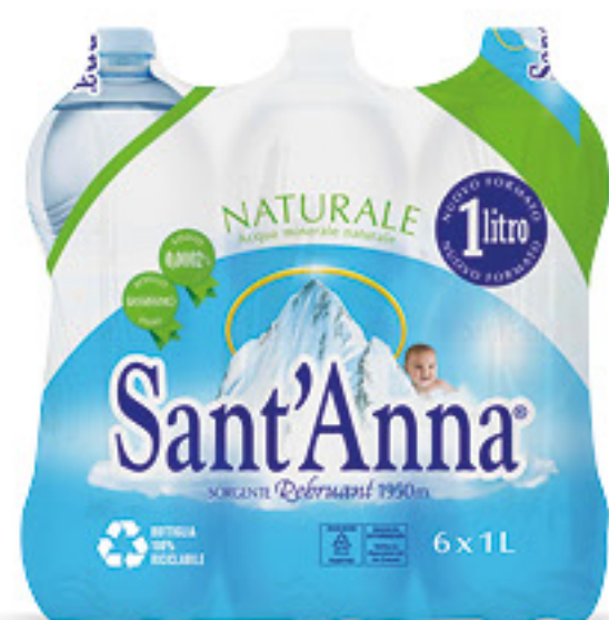
SANT'ANNA acqua minerale naturale l 1 x 6 bottiglie € 0,33 al lt 1,98