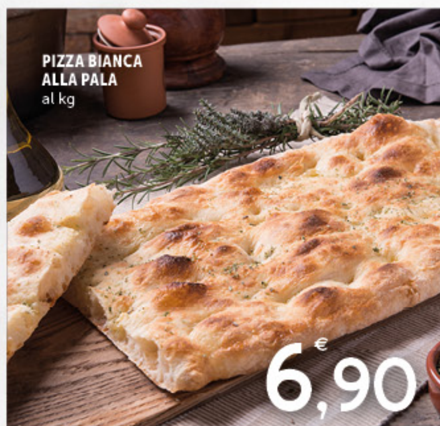
PIZZA BIANCA ALLA PALA al kg