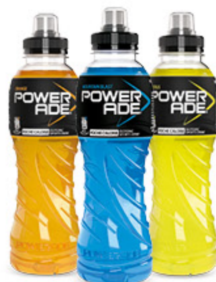
POWERADE vari tipi cl 50 € 1,70 al lt 0,85