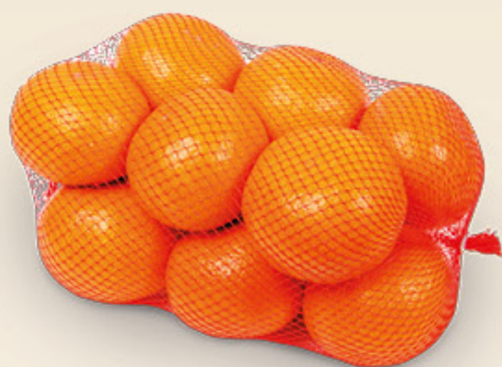
ARANCE NAVEL kg 1,5