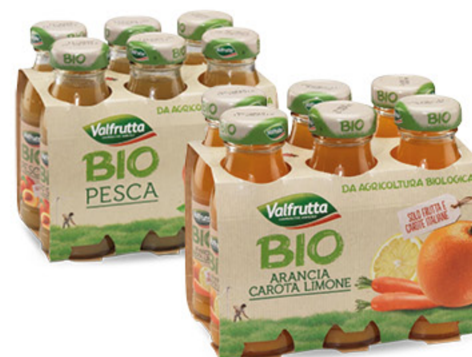
VALFRUTTA BIO succhi ml 125 x 6 • ace • pesca • pera € 3,72 al lt 2,79