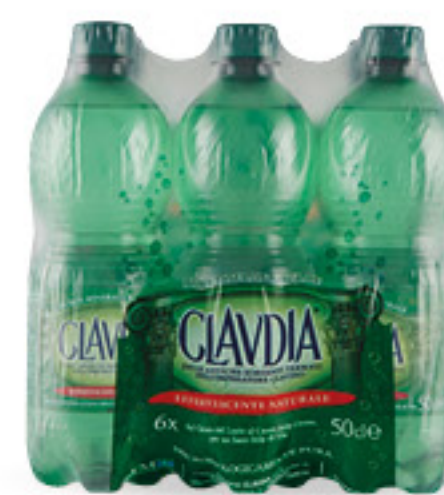
CLAUDIA acqua effervescente naturale cl 50 x 6 bottiglie € 0,32 al lt 0,96