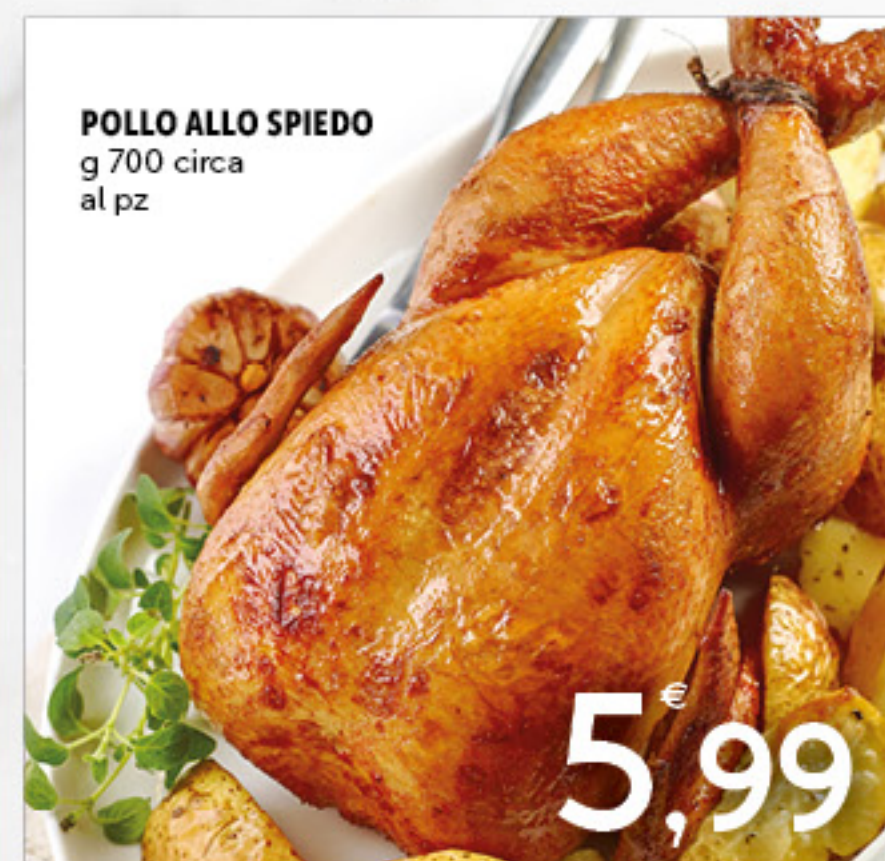
POLLO ALLO SPIEDO g 700 circa al pz