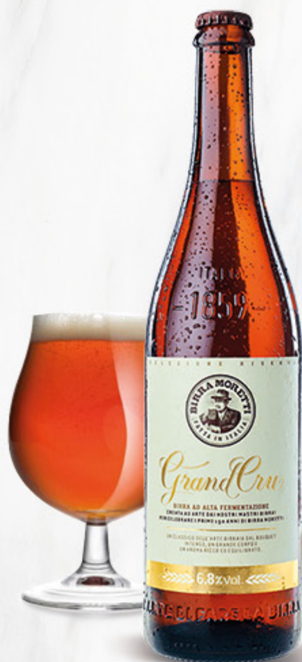
MORETTI grand cru birra cl 75 € 3,99 al lt 2,99