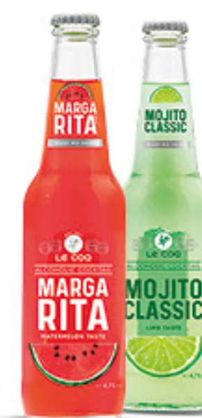
LE COQ cocktail vap cl 33 • margarita • mojito classic • sex on the beach • cosmopolitan • orange spritz € 3,97 al lt 1,19