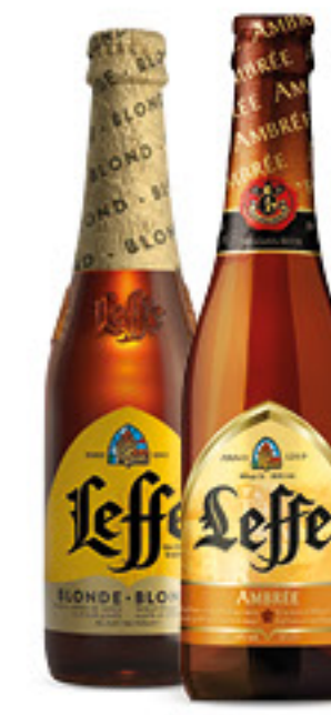
LEFFE birra cl 33 • rouge • blonde • ambrée € 4,52 al lt 1,49