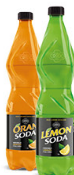
• LEMON-SODA • ORAN-SODA l 1 € 0,89