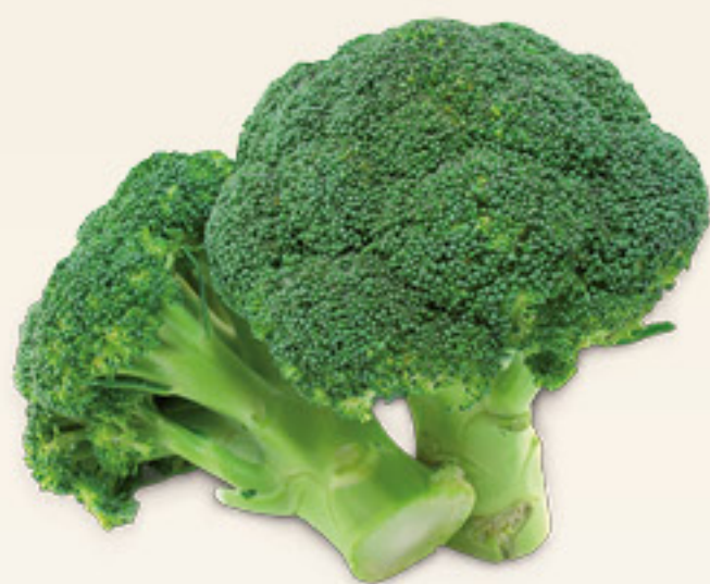
BROCCOLI g 500