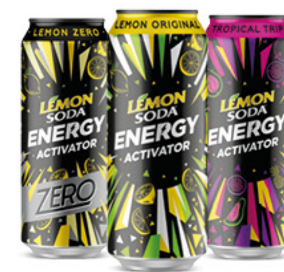
LEMONSODA energy activator vari gusti cl 50 € 2,00 al lt 1,00