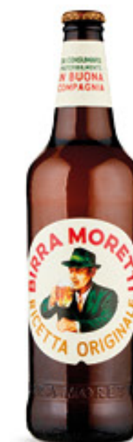
MORETTI birra cl 66 € 1,50 al lt 0,99