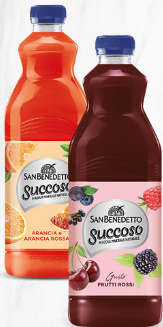
SAN BENEDETTO succoso alla frutta vari gusti l 1,5 € 0,79 al lt 1,19