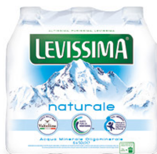
LEVISSIMA acqua minerale naturale cl 50 x 6 bottiglie € 0,50 al lt 1,50