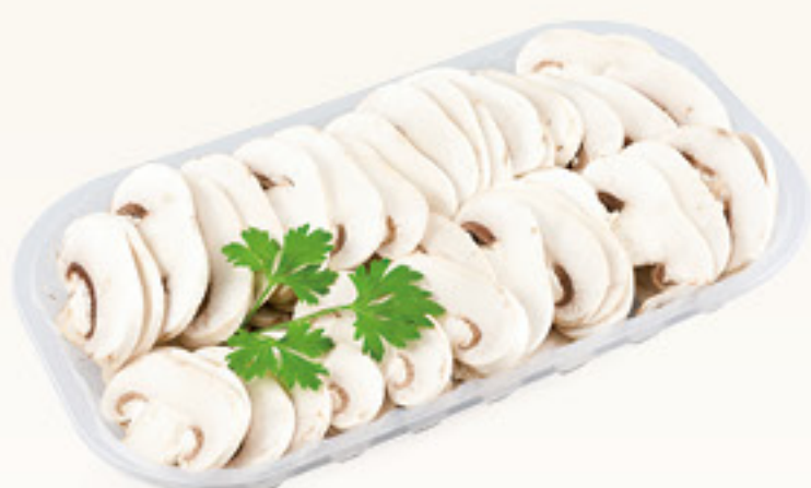
FUNGI CHAMPIGNON affettati cat. I origine Italia g 300