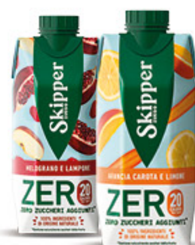
ZUEGG SKIPPER succhi senza zuccheri aggiunti vari gusti ml 330 € 1,97 al lt 0,65