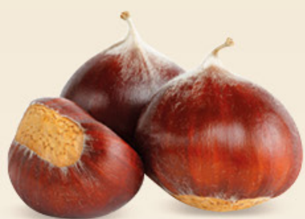
MARRONE DI ROCCA D'ASPIDE igp cat. 50/55 cat. I or. Italia cf g 500

Autunno, inizia a fare freddo, la natura ci viene in aiuto con deliziose e genuine primizie. Fresca frutta ricca di sali minerali e vitamine, e gustose verdure da usare come ingredienti per zuppe e vellutate.